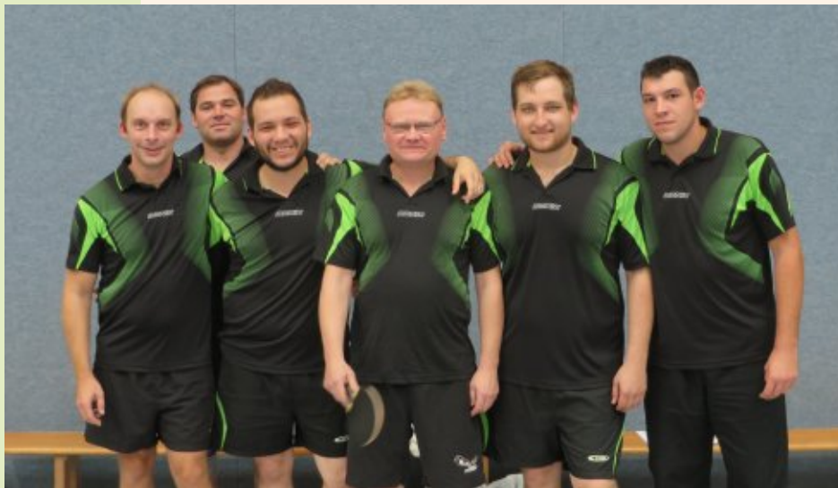
Tabelle Herren Kreisliga 1

nach 5 Begegnungen 7 Punkte eingefahren werden, so dass sich die Mannschaft zwischendurch sogar an der Tabellenspitze wieder fand. Mitten in der Saison traf unsere Zweite dann leider das Verletzungspech und das Fehlen von zeitweise zwei Spielern aus dem vorderen Paarkreuz konnte nicht kompensiert werden. In den restlichen Spielen der Vorrunde war so kein weiterer Punktgewinn möglich. Nichtsdestotrotz findet sich die Mannschaft auf einem Nichtabstiegsplatz wieder und in kompletter Aufstellung gehört sie auch sicherlich in diese Liga.